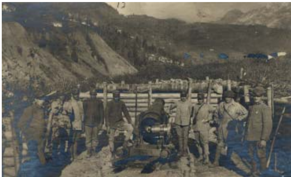
Fig. 10: Mortaio da 210 alle Muse.

dandoli vivamente di restare nascosti in modo da non farsi vedere da anima viva; io stesso dovevo ignorare il loro nascondiglio per evitare guai. Nonostante fui chiamato austriacante, spia e spalleggiatore dei tedeschi.