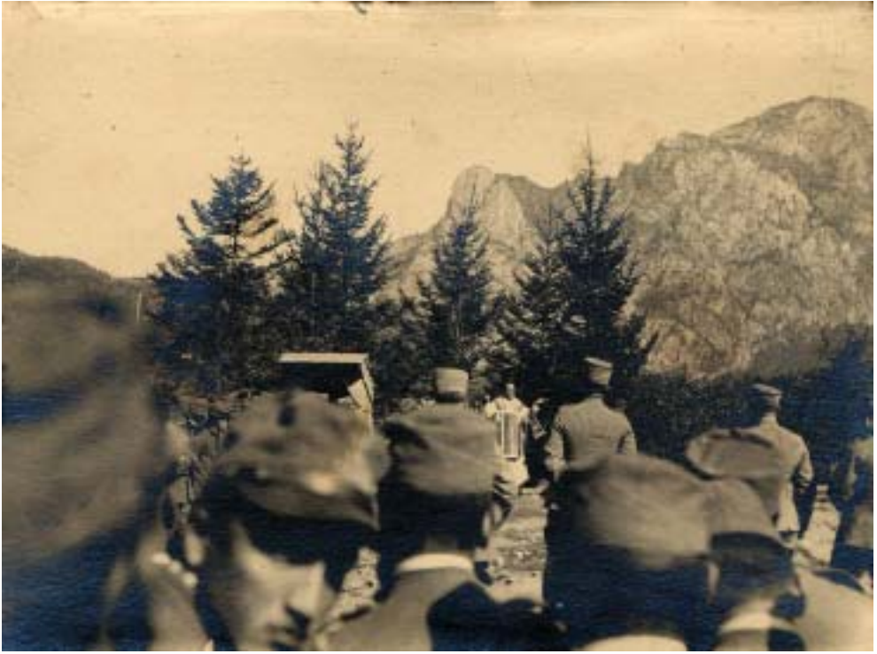
Fig. 8: Santa Messa al Moscardo.

militari, galletta, farina, riso, pasta, vestiario, utensili da casa e da lavoro, tutto fu loro proprietà. Ogni giorno comparivano nuove affissioni colle quali si avvertiva il popolo, già stremato, che tutto doveva passare nelle loro mani, che tutto doveva essere strozzato ciò che si chiamava diritto e personalità. Gli operai dovevano lavorare a sfornire le trincee, i baraccamenti, i ricoveri che erano stati dei nostri e trasportare il materiale in basso; era proibito lo scambio commerciale da paese a paese. Punizioni orribili erano in vigore per coloro che davano ricetto ad un prigioniero ed il premio di £. 50 a chi lo denunciava. Era tutto un regime di fango ove la vita morale era andata illanguidendo, consumando. L'uomo non era più uomo, si viveva in uno stato di schiavitù, si moriva un poco tutti i giorni. Tutto si doveva dire al Comando e nulla era permesso; non si poteva tenere in casa che una piccola razione di viveri: il necessario per non morire di fame.