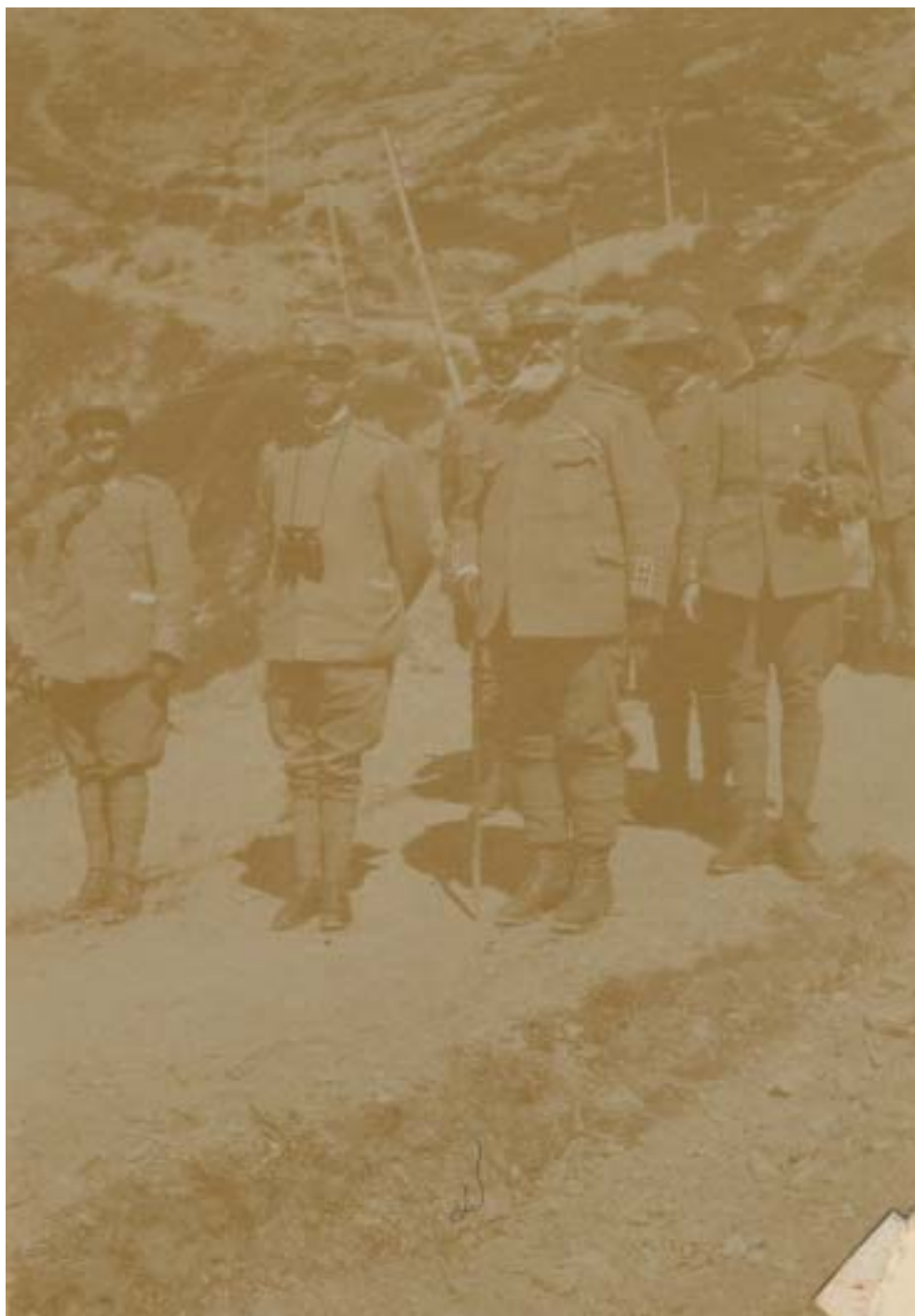
Fig. 9: “S.M. il Re a Casera Pramosio. Ten Bianco - Col. Antezza.”