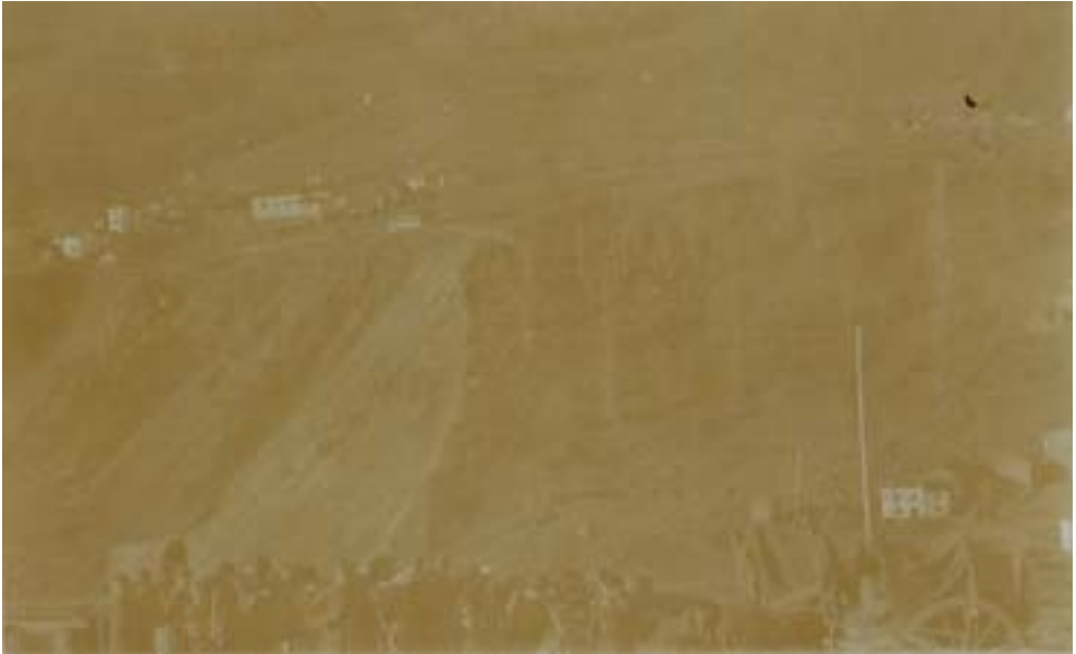
Fig. 2: Cleulis nel 1916.

Nella conferenza di Parigi, l'Italia ottenne l'Istria, il Trentino Alto Adige e l'alto bacino dell'Isonzo (trattato di S. German). Nel contesto post-bellico, ci fu poi la nascita (su ispirazione del presidente americano Wilson) dell'ONU, con sede a Ginevra.