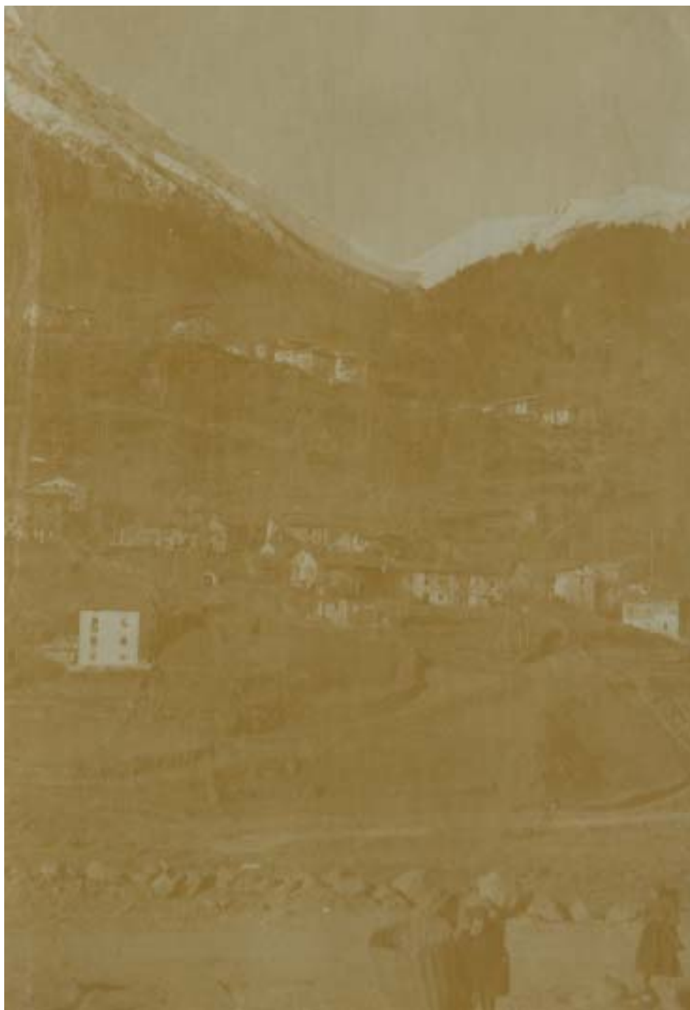
Fig. 11: Cleulis col costone del Tierz.