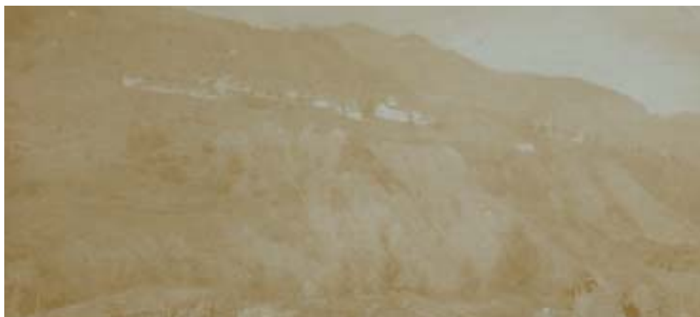
Fig. 6: Cleulis nel 1916.