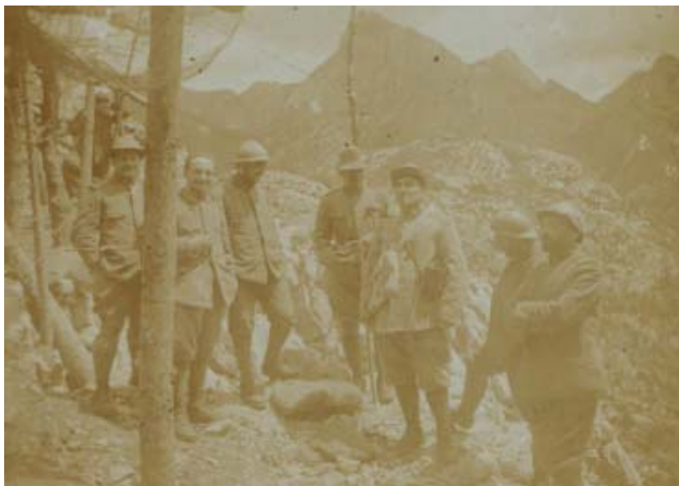
Fig. 3: Agosto 1916. Pre Florio a selletta Freikofel.

di Posta. Ottenne dal re d'Italia la Croce d'argento della Corona d'Italia per aver salvato una compagnia di alpini che in ricognizione sulle "Avostanis", nel 1903, aveva sconfinato in Austria. Fu al fianco dei combattenti. Spesso si recava in trincea e celebrava la santa messa fra i soldati.