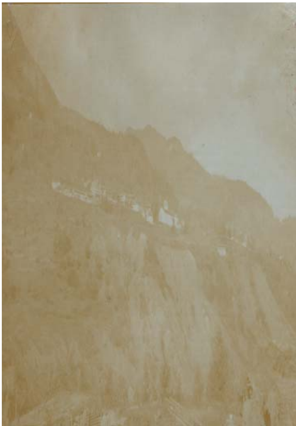
Fig. 7: Pagina del diario di Antonio Puntel.