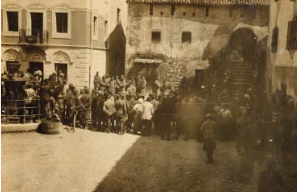
Fig. 12: Paluzza, prigionieri austriaci in attesa di essere internati.

gente Maggiore. Al momento di pagarla nessuno voleva saperne. Giocarono un po' a scaricabarile e a noi non rimasero che i buoni in cambio della nostra biancheria.